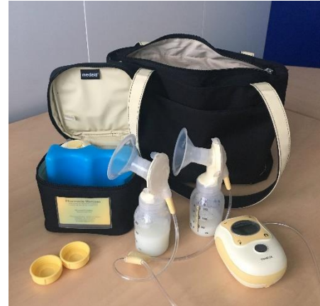
Moi et mon tire lait 33 ans